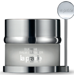
La Prairie Supreme Balm Cleanser CHF 176.– Bestell-Nr. 0026