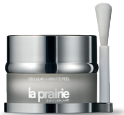
La Prairie Cellular 3 minute peel CHF ????.– Bestell-Nr. 0029