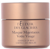
VALMONT Masque Majestueux votre visage CHF 450.– Bestell-Nr. 0030