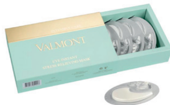
VALMONT Eye Instant Stress Relieving Mask Box CHF 148.– Bestell-Nr. 0031